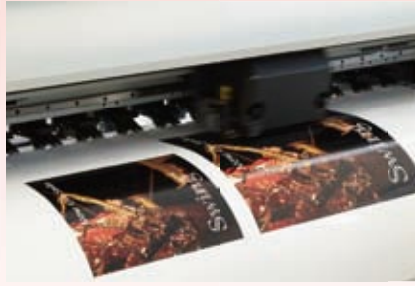
インクジェットプリンタでメディアに印刷