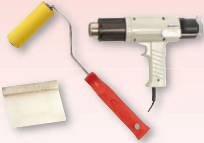
《施工道具》 スキージー・専用ローラー・ヒートガン