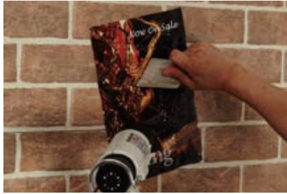
凹凸が激しい箇所は、スキージーでしっかりとおさえる