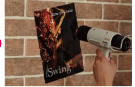
ヒートガンでシート全体を温める