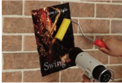
専用ローラーでしっかりと貼り付ける